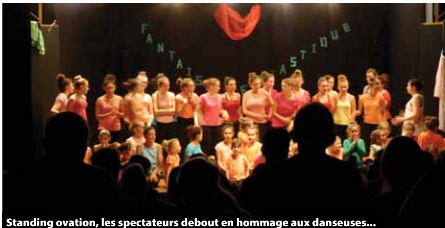
Standing ovation, les spectateurs debout en hommage aux danseuses...

Dimanche 22 mai, l'école de musique associative de la Communauté de Communes de l'Ouest Rhodanien - Diapazergues nous proposait son spectacle de fin d'année : CHOC AU LA à la salle des fêtes.